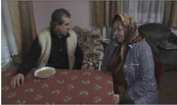
The second awakening of blindness , reż. Mauricio Franco (Hiszpania) 11'

On nie może zasnąć, ona nie może przestać myśleć. Dwoje ludzi niegdyś sobie bliskich dzieli niewidzialna bariera.