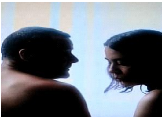
Taki typ ptactwa , reż. Małgorzata Goliszewska 12'

On nie może zasnąć, ona nie może przestać myśleć. Dwoje ludzi niegdyś sobie bliskich dzieli niewidzialna bariera.