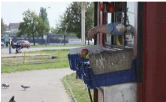
List , reż. Jakub Janz 13'

Portret pana Zygmunta – sprzedawcy warzyw, wielkiego miłośnika zwierząt. Kamera obserwuje go jego codzienność: rozmowy z klientami, reżyserką filmu oraz z... gołębiami.